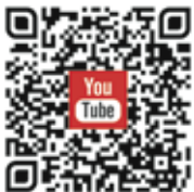
雲彩頻道 Silver Lining Channel