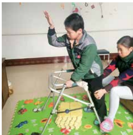
小霜在媽媽協助之下認真進行康復訓練。