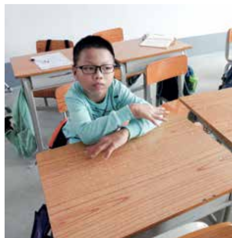
康復老師探訪慰慰，並一起去學校了解他的學習情況。