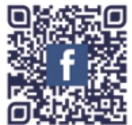
雲彩行動 Silver Lining Foundation