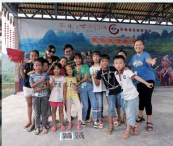
藉著遊戲讓小朋友學習合作精神和面對挑戰。