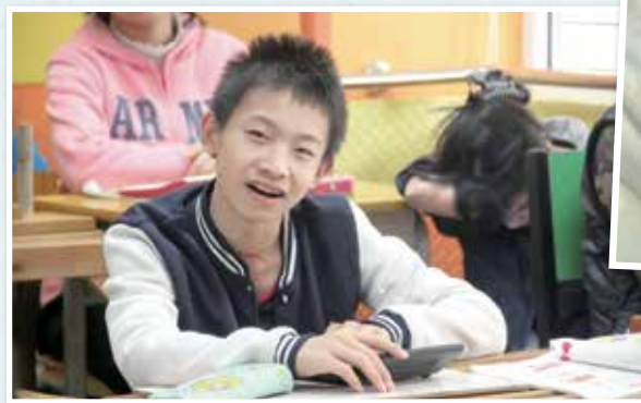
我和小旺慢慢走路到聖誕節慶祝活動的地點，過程中我非常欣賞他的堅持。

楊：「每個生命都值得尊重。」這是同工在介紹雲彩的工作時說的。幾天的相處讓這句話變得十分立體。我看見這些孩子的堅持和努力。有個孩子本來想坐車到活動地點，但在旁人的鼓勵和陪伴之下，他願意一步一步試著走，中途有機會坐車他也拒絕了，最後行了差不多一公里路。雖然他們有肢體上的限制，但總有他們可以發揮的地方。活動中孩子們合演了一齣話劇，有個孩子興奮地告訴我他要飾演一個爸爸。