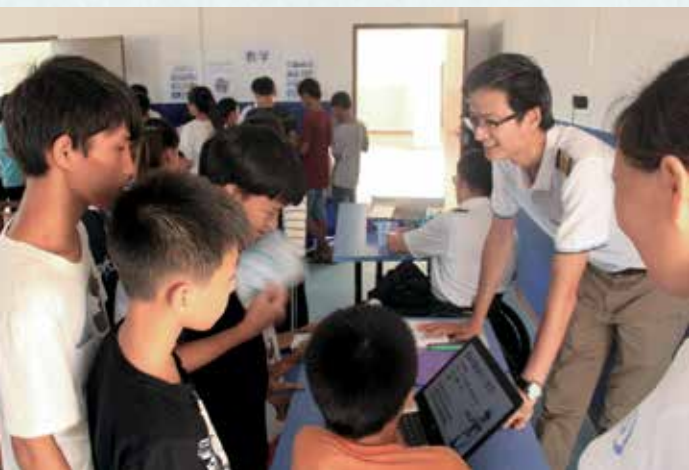
團隊以工作坊形式介紹不同行業，拓闊孩子的視野。

行程裏讓我最震撼的經驗，就是到康復中心跟腦癱孩子一起上課。我們看到中心為孩子們帶來的改變和影響，讓他們得到很多愛和盼望。看到上帝藉著雲彩祝福了很多人。不只是孩子本身，也祝福了他們身邊的人，為一些貧窮的家庭帶來希望。我鼓勵大家支持和參與雲彩的工作，祝福人的同時也豐富自己的生命！