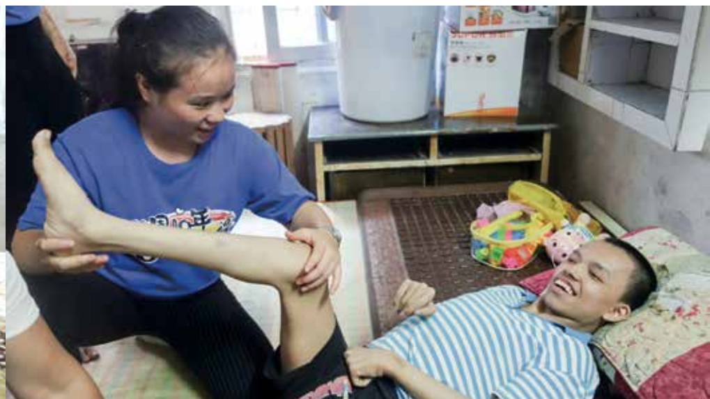
康復治療師定期家訪小加，了解孩子的康復進度。