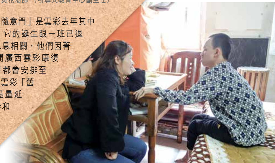
透過探訪，林老師（左）更加清楚明白孩子的需求。

遙距教育這度「隨意門」是雲彩去年其中一個重大突破！它的誕生跟一班已退學的腦癱孩子息息相關，他們因著各種原因而離開廣西雲彩康復中心。雲彩每年都會安排至少兩次探訪這些雲彩「舊生」，目的是盡量延續對他們的支持和關顧。