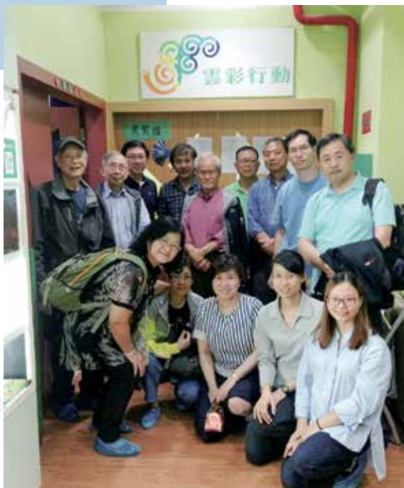
我（前排中）和一班弟兄姊妹一起到康復中心探訪。

作為一位腦神經科醫生，有機會與中心的導師們及家長在講座中交流分享，實屬難得。這些家長要照顧患有腦癱的小朋友已十分不容易，若小朋友同時患有腦癇症，家長的壓力想必更大！可以想象他們將有各種的擔心和疑問，我想藉這篇文章解答部分的問題：