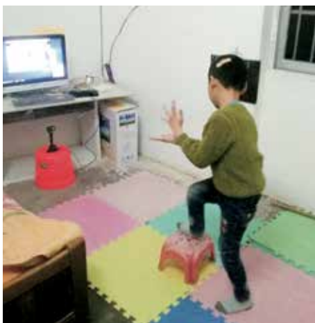
遙距教育讓小霜可以在家中繼續接受康復訓練。