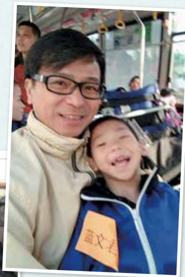
坐車時，小君每隔幾分鐘就抽插一次，腰背變得僵硬，可以想像平日的照顧真不容易。