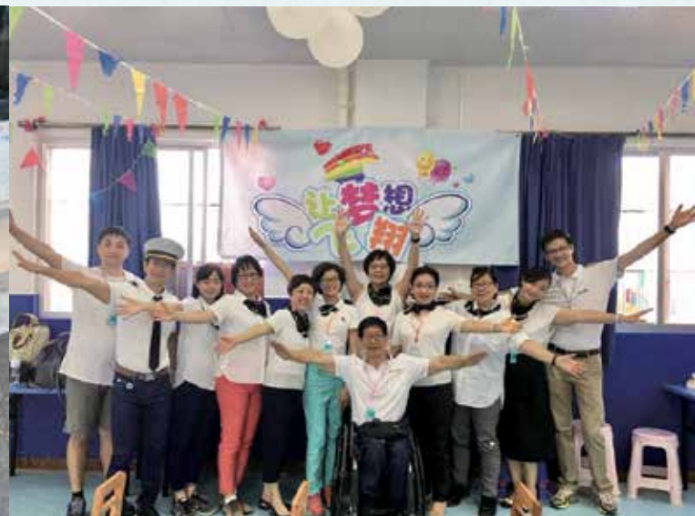
這次活動主題為「讓夢想飛翔」，來至新加坡的探訪隊化身為「夢想號」的機組人員，帶領小朋友，向夢想出發。

在整個探訪過程中，從籌備開始就遇到不少困難，包括出發前申請探訪文件時出現的問題、關愛中心的供電因著裝修的原故而不太穩定，以及中心四周全是爛路等等。正正是這樣，反而讓我們看到上帝是怎樣一步一步的帶領著著，為我們開路！最終，我們預備的所有環節都能夠順利完成。