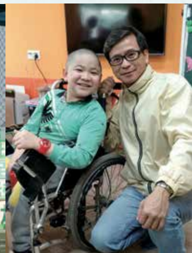
富港患有先天性骨折，年幼時只能留在家中，後來遇上雲彩行動，才有機會讀書。