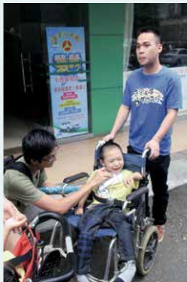
參觀腦癱中心後，帶領腦癱小朋友外遊。