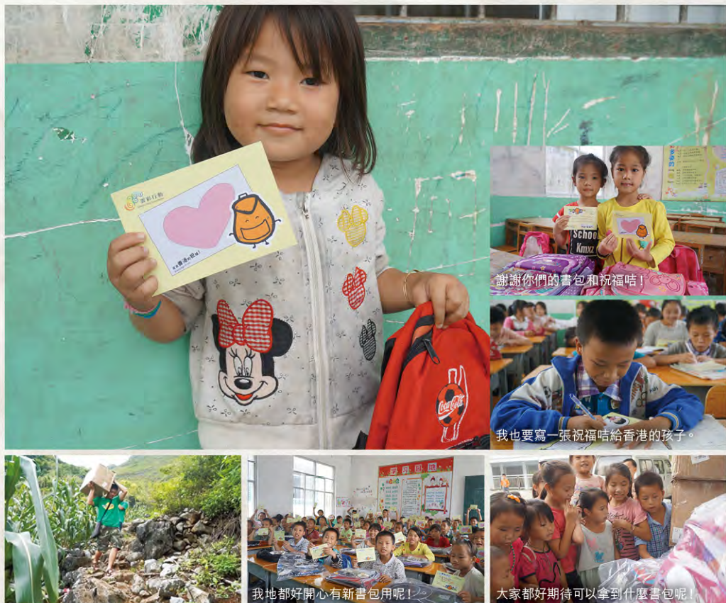
謝謝你們的書包和祝福咭！