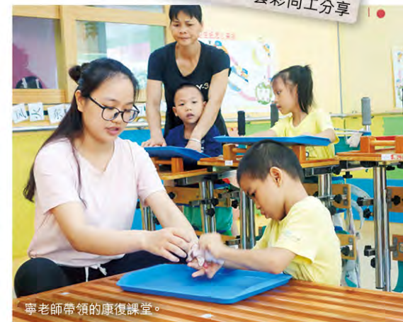
寧老師帶領的康復課堂。

雖然康復是我的專業，但我卻是第一次接觸「引導式教育」（將教育與治療結合成一個整合的訓練系統），很多東西我都不懂。當我想用這個方法幫助孩子，卻發現沒有預期的效果時，自己就更加心急。幸好有同事的提點，讓我在失敗中發現問題，再尋求解決方法。