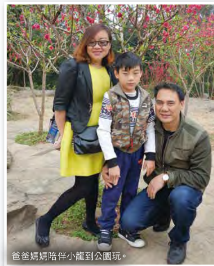
爸爸媽媽陪伴小龍到公園玩。

這次夫妻營收穫豐富，幾天的課程裏，我明白到原來表達愛也要先了解對方的需要，否則對方未必會接收得到的。另外，在表達個人感受的方面，我明白到無論是開心的、不開心的也要說出來。經過這幾天的相處和學習，我們的夫妻關係緩和了不少。