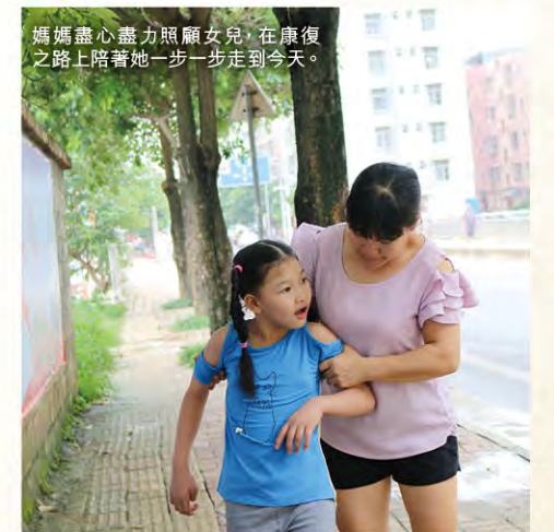
媽媽盡心盡力照顧女兒，在康復之路上陪著她一步一步走到今天。

今年十月六日是「世界腦癱日」，讓我們一同關注腦癱孩子與家庭，幫助他們走得更遠、更有力。☺