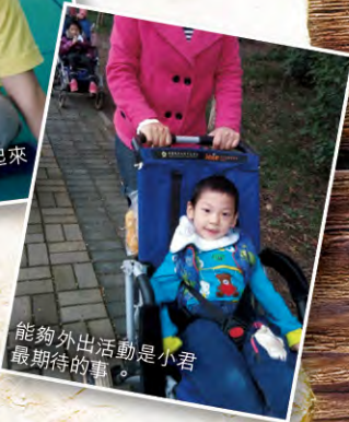
能夠外出活動是小君最期待的事。