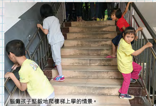
腦癱孩子堅毅地爬樓梯上學的情景。

提筆撰寫這篇分享時，那些讓我們感恩的片段，一幕一幕在腦海中浮現。那刻遇見雲彩的腦癱孩子堅毅地爬樓梯上學的情景、無數同工們在資源欠缺的環境下，因著孩子的學習需要而滿有智慧和創意地為他們製作不同治療輔具的畫面、家長在艱難的生活裡，仍然不離不棄地栽培孩子的分享。以上的畫面，從我離開雲彩那天至今，依然不時在我思海裡重現。