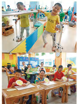
小源是康復中心的「開心果」，常常把大家逗得哈哈大笑！

接觸腦癱孩子多了，常被他們的堅持及毅力所感動。他們的身體都有著不同的限制，在常人看來簡單如走路、說話、寫字等動作，他們可能要用上一日、一個月甚至一年得時間重複練習方能學會。成長的每一步對他們來說都是艱鉅的任務，然而對這班腦癱孩子來說，能像普通孩子一樣去上學是快樂的，能同伴玩耍是開心的。記得有一次，康復中心有個腦癱孩