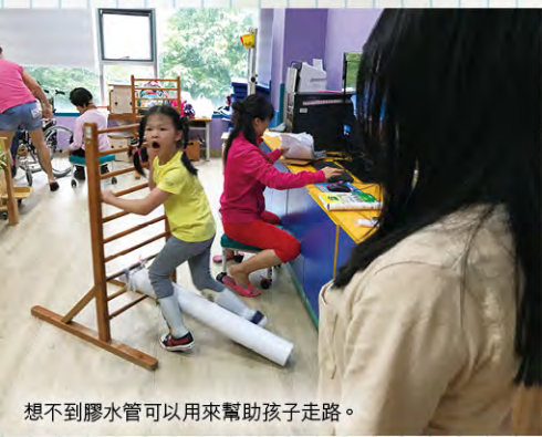
想不到膠水管可以用來幫助孩子走路。

在香港，我們幾乎沒有一所為肢體殘障兒童而設的幼兒復康中心會位於二樓。然而，雲彩社會服務中心正正是設置在二樓的。在這裡讀書的孩子就是每天努力的扶著樓梯的欄杆，一步一步地、艱辛地走樓梯上學去。但是，那裏的孩子總是笑容滿面的走路，抱著極為期待的心情回到學校。