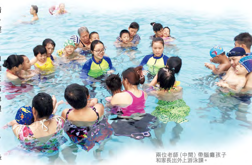
兩位老師（中間）帶腦癱孩子和家長出外游泳課。

在這一年裡，讓我體會最深的是真誠地對待自己的工作和身邊的每一個人，盡自己最大的努力去幫助腦癱孩子們。希望自己以後會做得更好！🙏