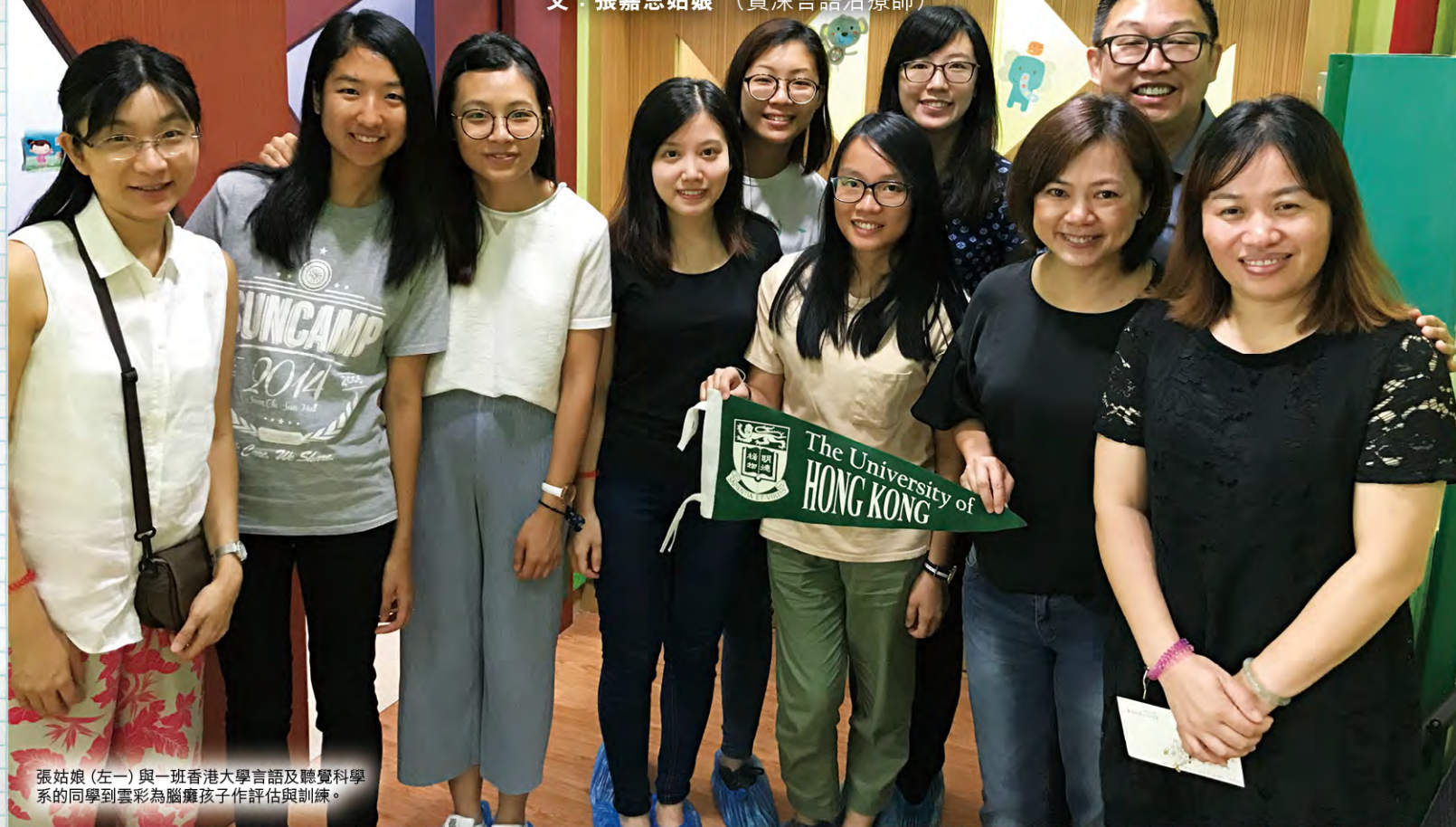
張姑娘（左一）與一班香港大學言語及聽覺科學系的同學到雲彩為腦癱孩子作評估與訓練。