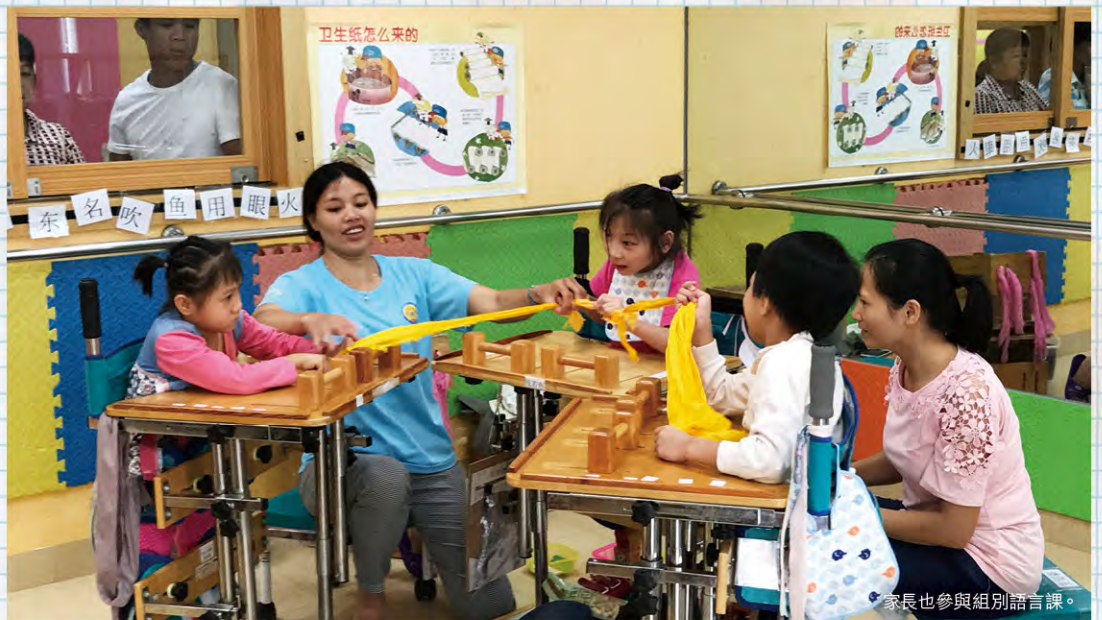
家長也參與組別語言課。

雲彩的資源是有限，但老師們卻都滿有熱忱地為孩子及他們的家人服務。那裏為肢體殘障兒童而設的治療用品不多，但是老師、支援同工和家長都願意為孩子多花心思，運用各種僅有的資源為孩子創作合適的治療工具。我從來沒有想到簡單的一雙襪子可以充當手紮，幫助孩子控制手指來更準確地按鍵盤。更沒想到膠水管既能用來固定碗子，又能用來幫助孩子把兩腿分開，繼而更穩定的走路。這些因著愛孩子而來的創意，不但使孩子的內在功能發揮得更好，也成為他們不怕困難，繼續努力的原動力！