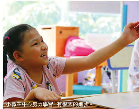
小微在中心努力學習，有很大的進步。

子因為全身抽搐，需要馬上送去醫院，孩子一路上都不停的哭著要回去上課。每次當我工作特別繁忙時，我總喜歡走進孩子的課堂，和孩子們在一起，心情也會明朗起來！