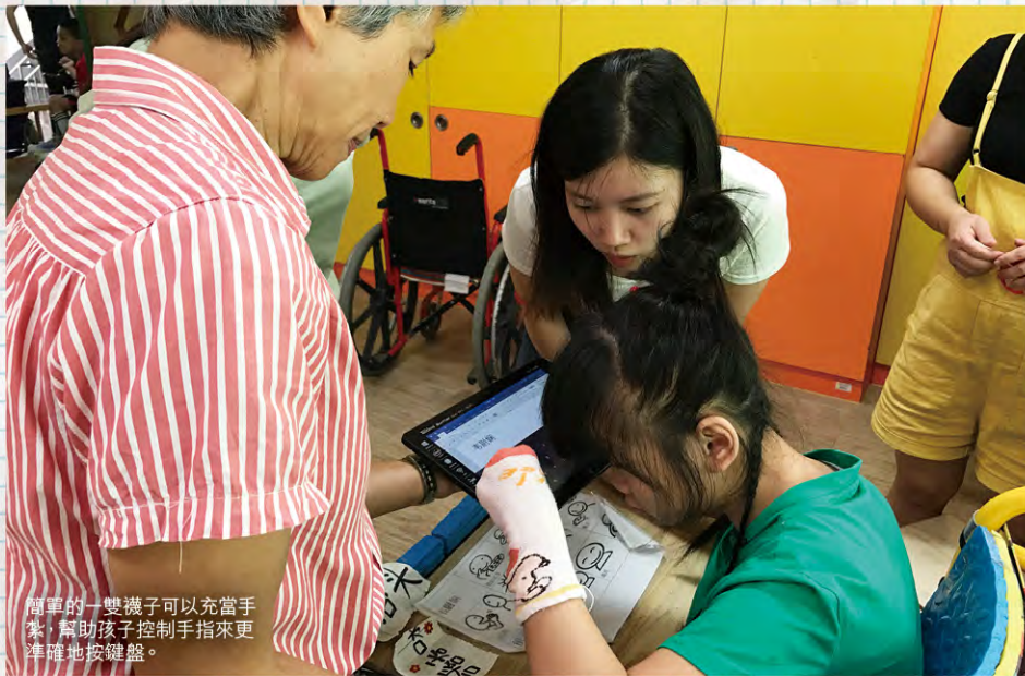
簡單的一雙襪子可以充當手紮，幫助孩子控制手指來更準確地按鍵盤。