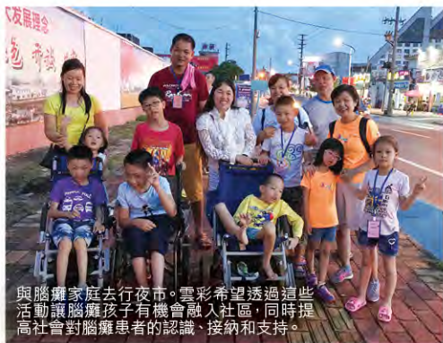
與腦癱家庭去行夜市。雲彩希望透過這些活動讓腦癱孩子有機會融入社區，同時提高社會對腦癱患者的認識、接納和支持。