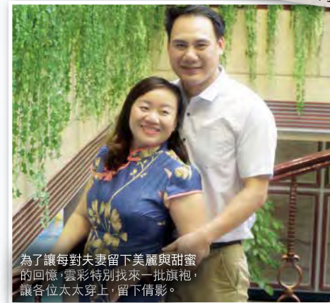
為了讓每對夫妻留下美麗與甜蜜的回憶，雲彩特別找來一批旗袍，讓各位太太穿上，留下倩影。

夫妻營一次比一次辦得好，團隊精心佈置我們的燭光晚餐，同工及老師們實在付出了很多。今次的參加者當中有不少新到來的夫妻，他們也分享說在雲彩這個大家庭裡很開心，孩子也很開心。我知道我所經歷過的，他們也在經歷。愛的力量真的可以很大，愛心人士透過不同方式支持我們，面對這份不離不棄的愛，我們還有什麼理由放棄。