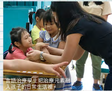
言語治療學生把治療元素融入孩子的日常生活裡。