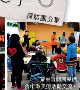
單車隊與同學們 合作做美勞活動交流。