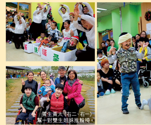
黃生黃太(右二、右一)幫一對雙生姐妹推輪椅。

透過探訪，能夠更深明白關愛中心及復康中心如何凝聚這些孩子，團結微小力量，相互扶持，為生命創造溫馨的雲彩。☺