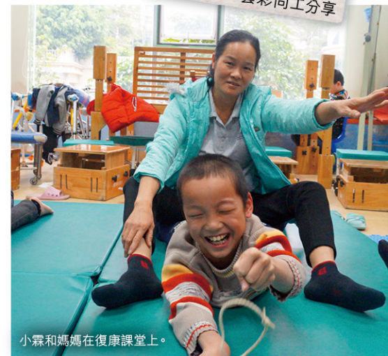
小霖和媽媽在復康課堂上。