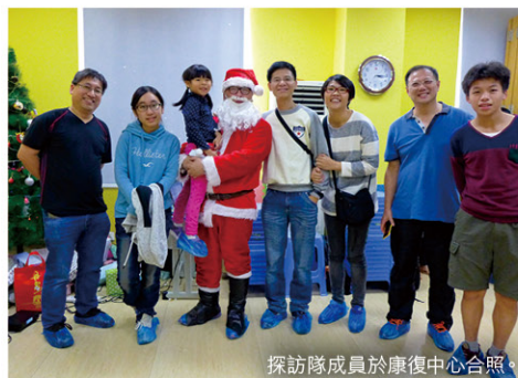
探訪隊成員於康復中心合照。

在關愛中心，大家一起玩，一同吃美味的蛋糕，孩子們睜大眼睛望著神奇的打印機如何把剛才與聖誕老人的珍貴合照一張張打印出來。在房間和操場裡都充滿歡笑聲。但當我和孩子們個別傾談，問到他們來到這中心有多久時，他們卻靜了下來，從他們突然茫然的眼神，已感受到他們被遺棄但講不出來的心聲，頓時令我心裡流淚。