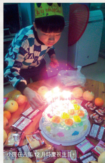
小院在去年12月時慶祝生日。