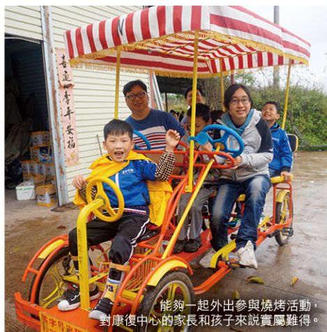
能夠一起外出參與燒烤活動，對康復中心的家長和孩子來說實屬難得。

回程時，她在火車上哭了幾次，告訴我不開心，想回到南寧，相信是她很不捨得她的朋友及那小孩，那刻我也被感動。這一切，我想並不能從書本或學校裡學到，希望日後再有機會參加探訪。