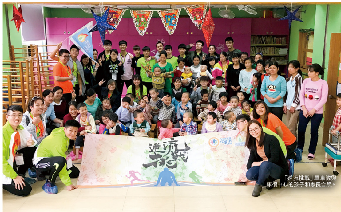
「逆流挑戰」單車隊與 康復中心的孩子和家長合照。

多年來各項活動，如果沒有雲彩一眾職員和義工背後默默付出，相信很多兒童現在便沒有如此的教育、服務和設施。我在想：如果今年暑假自身有能力的話，我都要成為義工去關懷社會上一些可能因為社會資源和財富分配不均的問題，而被摒諸於社會和經濟制度邊緣的小眾，例如貧窮人士、老人、殘障人士以及少數族裔等，希望好像雲彩行動的宣言一樣，「以生命改變生命」。