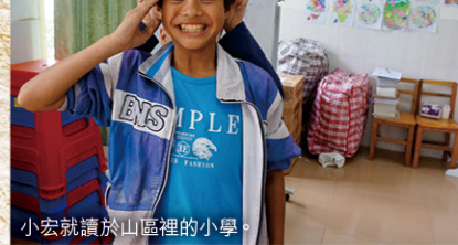
小宏就讀於山區裡的小學。