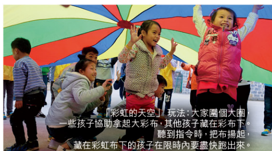
「彩虹的天空」玩法：大家圍個大圈，一些孩子協助拿起大彩布，其他孩子藏在彩布下，聽到指令時，把布揚起，藏在彩虹布下的孩子在限時內要盡快跑出來。