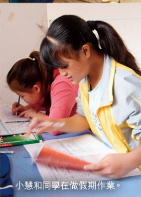
小慧和同學在做假期作業。