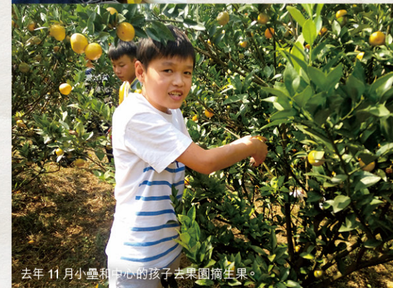
去年 11 月小壘和中心的孩子去果園摘生果。