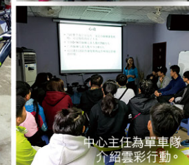
中心主任為單車隊 介紹雲彩行動。