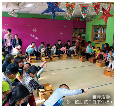
團隊活動： 一對一協助孩子做下午操。