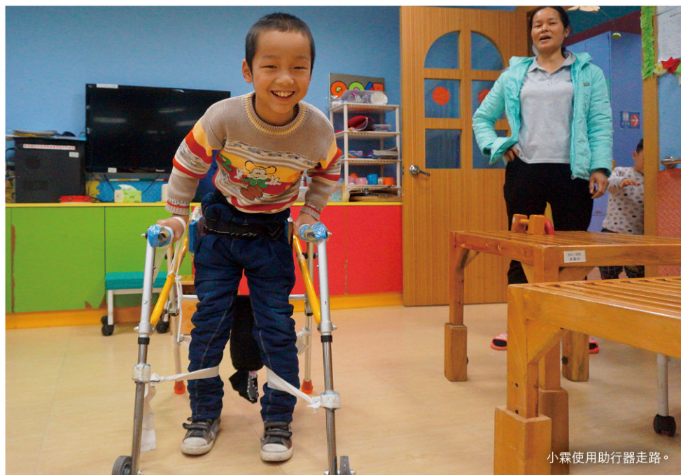
小霖使用助行器走路。