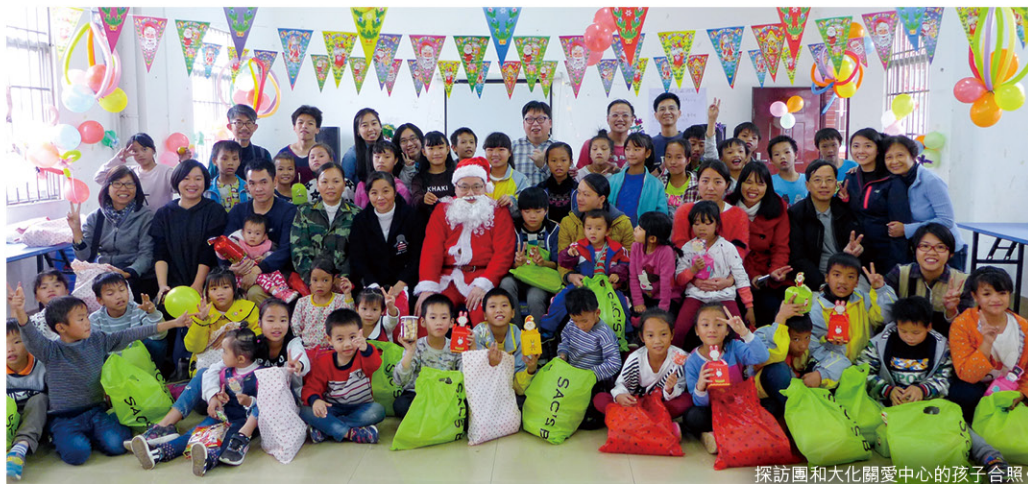
探訪團和大化關愛中心的孩子合照。

短短幾天裡，雲彩行動給了我寶貴的人生體驗。願我們努力在絕望之處播下盼望，在冷漠中播下溫暖，在遺棄中播下接納，叫更多的生命重燃希望和溫暖。☺