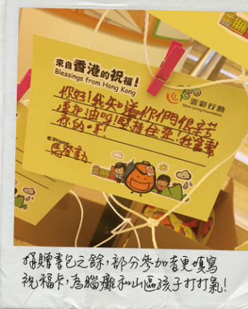
捐贈書包之餘，部分參加者更填寫祝福卡，為腦癱和山區孩子打氣！