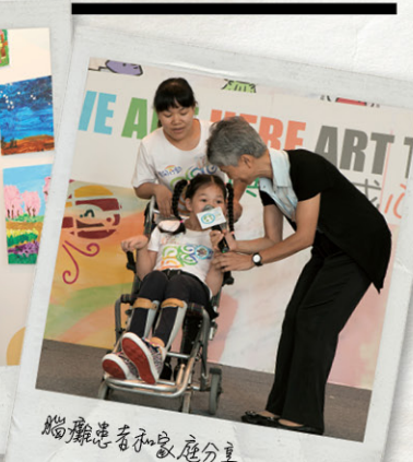
腦癱患者和家庭分享