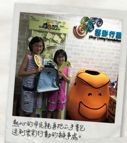
熱心的市民親身把二手書包送到雲彩行動的辦事處。