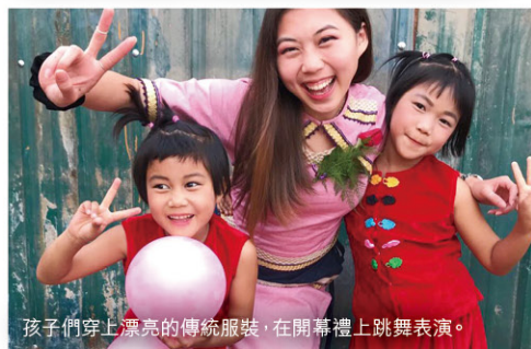
孩子們穿上漂亮的傳統服裝，在開幕禮上跳舞表演。