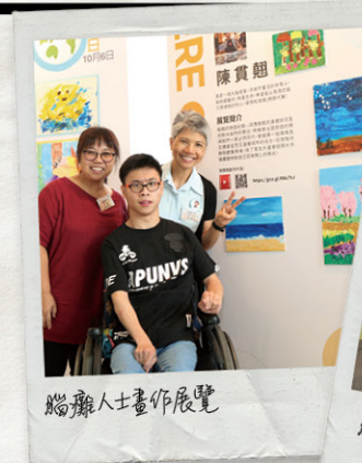
腦癱人士畫作展覽

除了板畫創作，當日還有不同參加單位的畫作展覽、體驗攤位、舞蹈歌唱表演，以及腦癱人士和家庭的真誠分享。盼望我們日後繼續努力，攜手實踐傷健共融的社會！