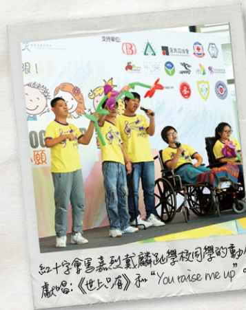
紅十字會馬嘉烈戴麟趾學校同學的動人獻唱：《世上只有》和「You raise me up」。