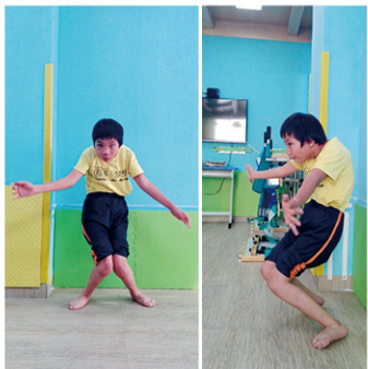
手術前的晶晶，不能站直，走幾步就摔倒。