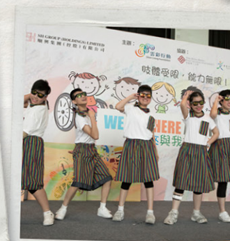
香港基督教服務處培愛學校的舞蹈表演。