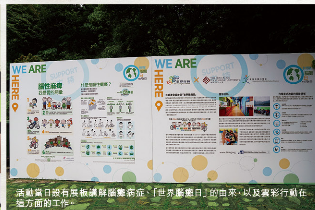
活動當日設有展板講解腦癱病症、「世界腦癱日」的由來，以及雲彩行動在這方面的工作。