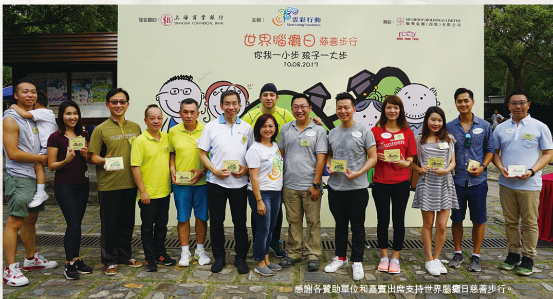
感謝各贊助單位和嘉賓出席支持世界腦癱日慈善步行。