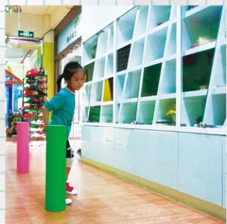
繞著豎起來的滾筒拐彎走。

九月份新學期開始，廣西雲彩的康復中心增設了兩間術後康復室，讓腦癱孩子練習不同的運動：繞著豎起來的滾筒拐彎走；坐在大圓球上搖動；也有扶著欄竿橫著走的；各適其式，卻一致的不鬆懈。一個小時的密集訓練後，各自回到自己的課室繼續其他課堂的學習，沒有倦意，反而顯出一臉滿足感。是什麼一回事呢？