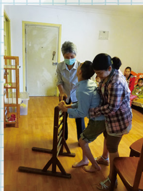
金喜手術前不會站立。