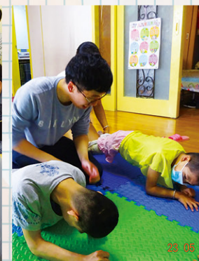
房角石康復專業義工到小家指導。