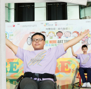
香港紅十字會甘迺迪中心的輪椅舞表演。