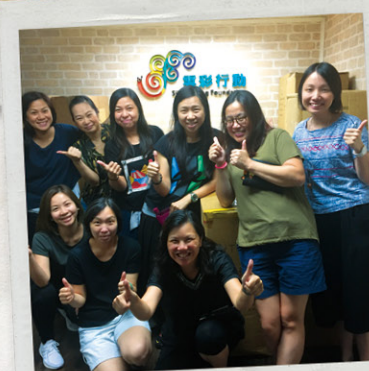
義工們努力整理書包。