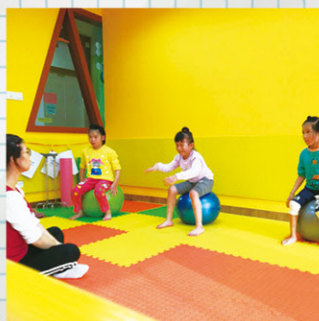
坐在大圓球上搖動。