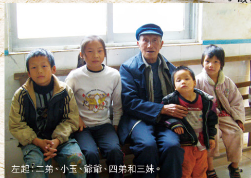
左起：二弟、小玉、爺爺、四弟和三妹。

而哭泣，但是哭一點都沒有用，生活還是要繼續，所以我們倆經常一邊哭一邊幹活，媽媽看到我們哭泣，她也非常心疼的抱著我們一起流淚，那個場景直到現在，當我再回憶起來，還是會淚流滿面。那時的我羨慕人家有爸爸，因為農活很快就可以完成，而我家……當別人在休息的時候，我家的地還有一半沒有種完，讓我感動的是二伯和他的家人一有空就過來幫我們幹農活。