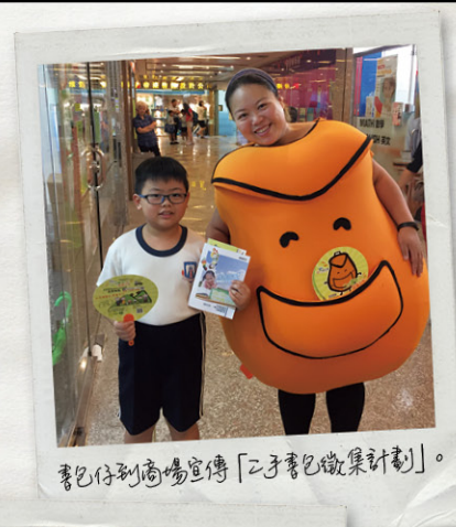
書包仔到商場宣傳「二手書包徵集計劃」。