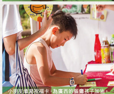
小朋友填寫祝福卡，為廣西的腦癱孩子加油。