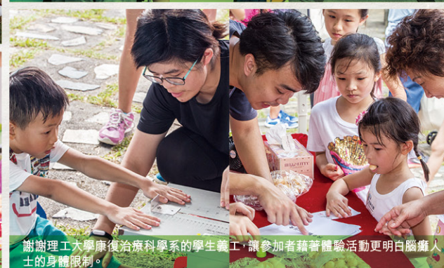
謝謝理工大學康復治療科學系的學生義工，讓參加者藉著體驗活動更明白腦癱人士的身體限制。