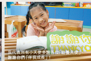
我代表所有小天使多謝各位「助養天使」，謝謝你們「伴我成長」！