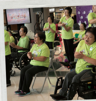
回聲各相見福音協會的傷健讚美隊。