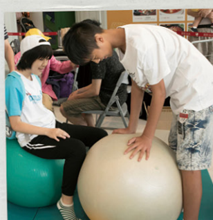
理工大學康復治療科學系的體驗攤位