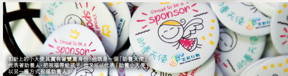
扣針上的小天使其實有著雙重身份，他既是一個「助養天使」，代表著助養人，把祝福帶給孩子；他又可以代表「助養小天使」，以另一種方式祝福助養人！