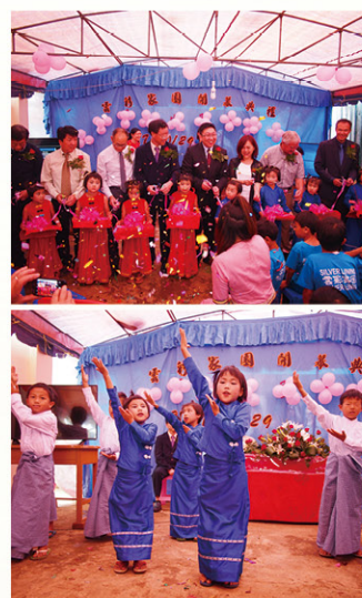
開幕禮上，孩子們都穿上緬甸民族服裝，並獻上精彩的歌舞表演。