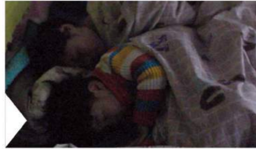
飯後睡一睡，勝過當元帥