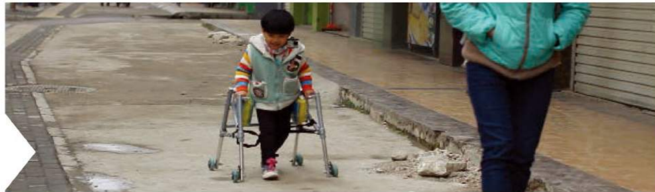
下課了，媽媽和我回家咯

一天就這麼結束了，腦癱兒童家庭的一天真的很不容易，盼望更多人能幫助他們，關愛他們。