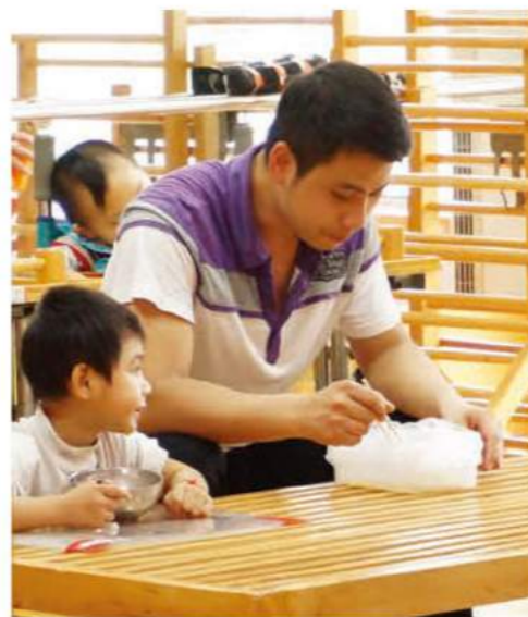
每天都過得很充實