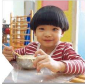
午飯了，我懂得自己吃飯