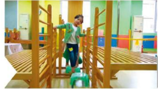
睡醒有力氣做肌肉訓練